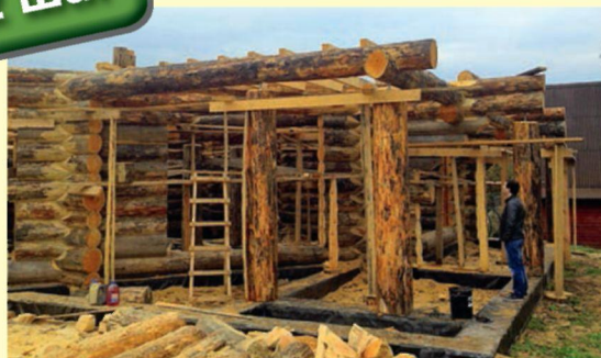
Первый этаж сруба

Ручная рубка выполнялась прямо на стройплощадке, как в старые добрые времена. Мастера-плотники выбирали угловые замковые соединения и промежуточные врубки, обрабатывали оконные и дверные проемы и выполняли другие операции с высокой точностью и на самом высоком профессиональном уровне. Венцы так плотно прилегают друг к другу, что между ними даже спичку не вставишь. Проверяли.