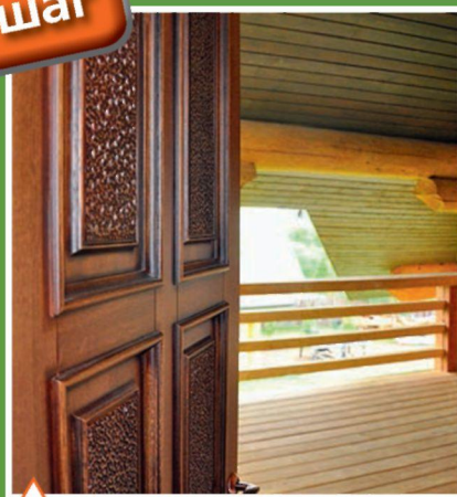
Классическая филенчатая дверь открывает выход на балкон