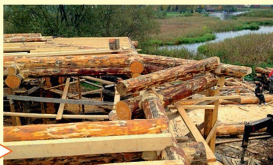
Устройство балочного перекрытия первого этажа