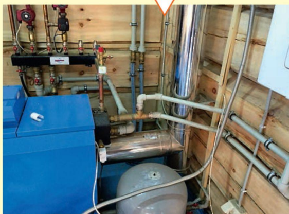
Котельное оборудование дома