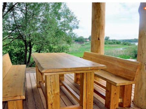
Вид на залив с открытой террасы

Панорамные стеклянные двери ведут на просторную террасу площадью 80 кв. м с дощатым настилом из лиственницы. Семья проводит здесь много времени. Летом хозяева даже выставляют на террасу холодильник, чтобы не бегать в дом за напитками и продуктами во время семейных трапез и посиделок за самодельным столом из оставшегося после строительства кедр.