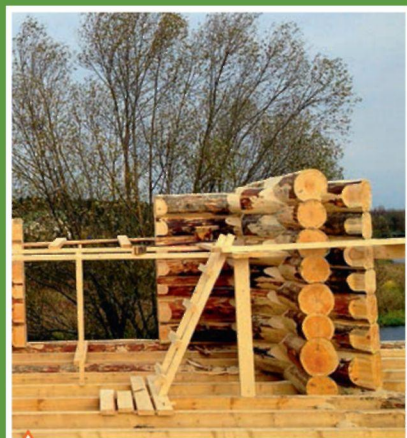
Возведение второго этажа дома и укладка лаг чернового пола по балочному перекрытию