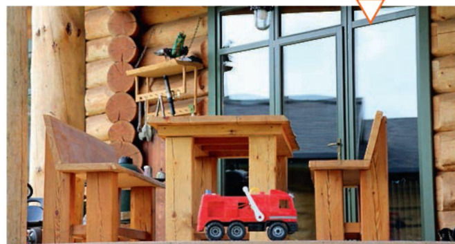
Стеклопакетный портал и рабочий уголок хозяина на террасе