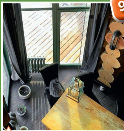
Обеденный стол из незыблемого тика

Мебель для дома в основном заказали в Италии. Некоторые предметы приобрели в московских антикварных магазинах. В гостиной постелили туркменский ковер ручной работы. Хозяева стремились создать современный интерьер, в котором гармонично сочетаются разные стили и материалы. В кедровые стены отлично вписались лакированная итальянская кухня со столешницей в стиле хай-тек и металлическая лампа.