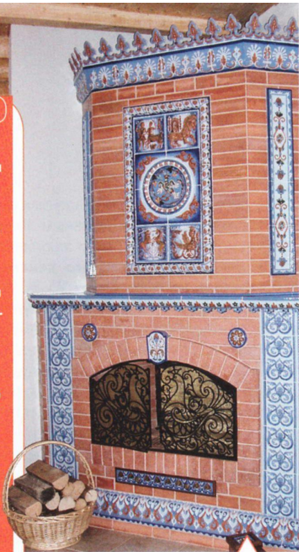
Кирпичная печь с изразцами работы мастеров керамической мастерской Андреевского монастыря

● При выборе места для камина учитывайте, что дымоход должен располагаться на определенном расстоянии от электропроводки и газового трубопровода. Зазор между топкой и стеной должен быть не менее 10 см. Топки устанавливают на фундаментную плиту. Если камин располагают на втором этаже, то усиливают железобетонное перекрытие.