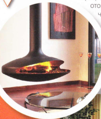
Камин Focus с открытой топкой, выполненный в стиле хай-тек