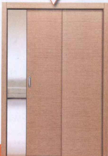
Дверь Valley (ф. Union)