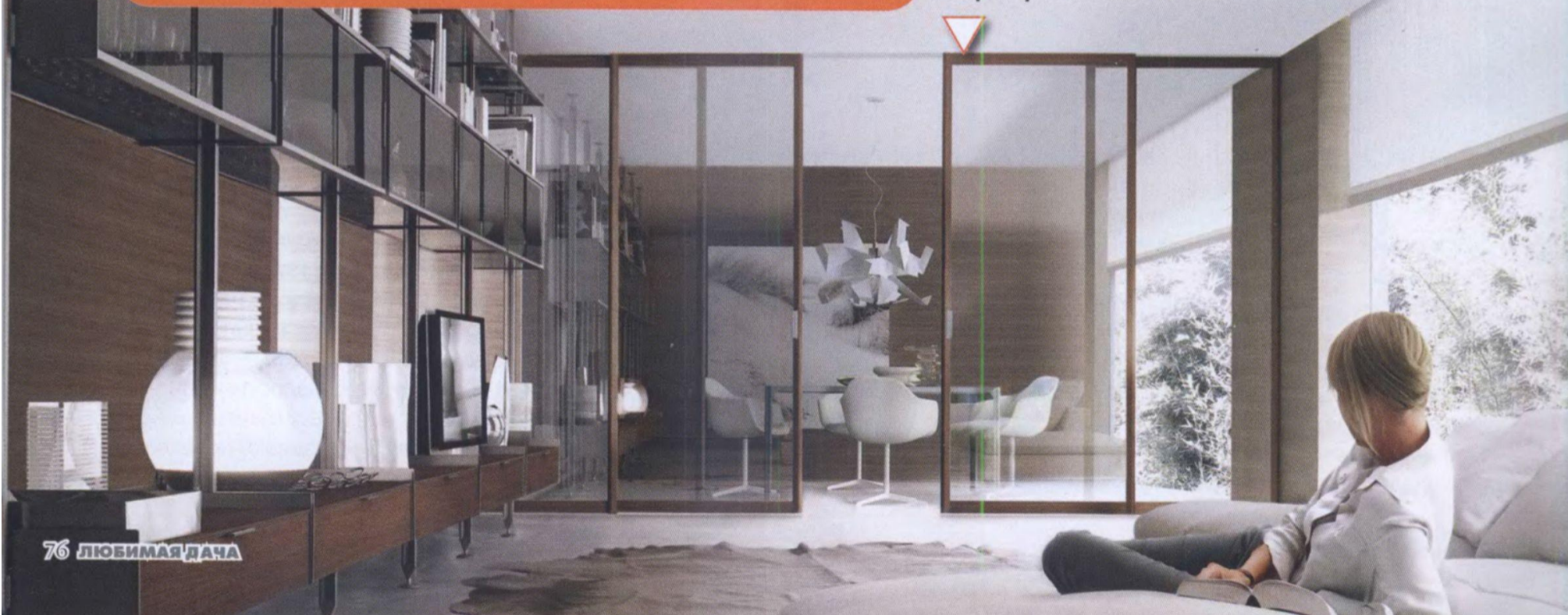
Стеклянные межкомнатные перегородки Rimadesio

В последние годы шпон весьма активно теснит ламинированную отделку. Такое покрытие может имитировать практически любые породы дерева.