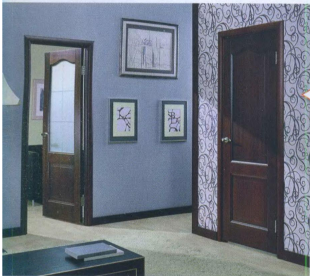
Дверь FOA, коллекция Glamour (ф. «Лендор»)