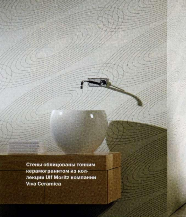
Стены облицованы тонким керамогранитом из коллекции Ulf Moritz компании Viva Ceramica