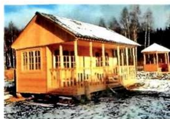
Летняя кухня

Кроме того, важно предусмотреть естественную вентиляцию хозблока (особенно если планируется хранение удобрений и другой химии), естественное и электрическое освещение. Окна должны быть столько, чтобы днем в сарае было светло.