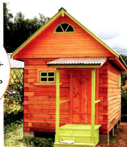
Самый простой способ преобразить старую постройку – покрасить ее в яркий цвет, так чтобы он контрастировал с зелеными посадками

Н е ошибитесь с маркой утеплителя. Приобретать следует продукцию, предназначенную для стеновых конструкций.