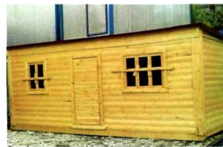
Хозблок из бруса ф. «Бытовка.ру»