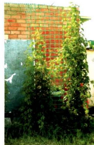
Выращенные по сетке растения очень быстро закроют неприглядную стену постройки.