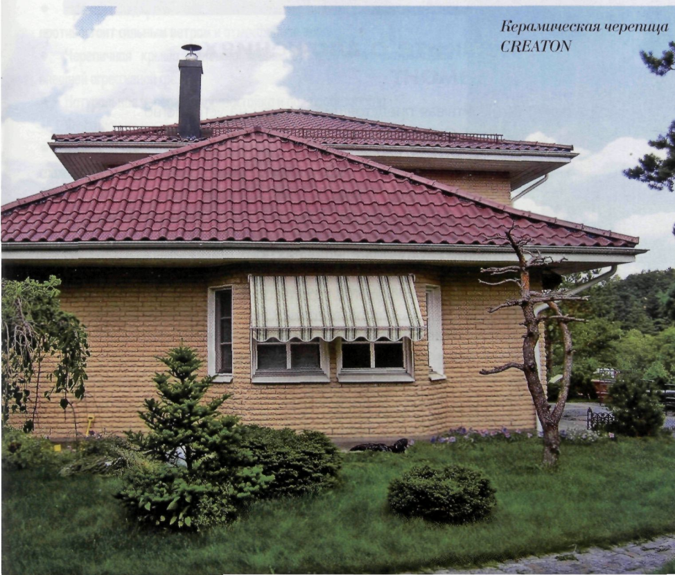
Керамическая черепица CREATON

З аказывая проект будущего загородного владения, обсудите с архитектором кровельный «вопрос». Таким образом, уже на начальной стадии проектирования будут учтены ваши предпочтения в отношении кровельного покрытия, а также финансовые планы на приобретение материалов и оплату монтажных работ.