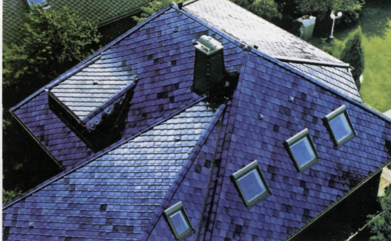
Натуральная черепица BRAAS