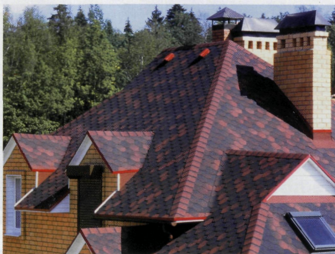
Гибкая черепица RUFLEX